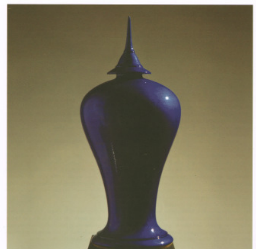
TOMMY ZEN, céramique et feuilles d'argent, 18" x 7" - 45 -