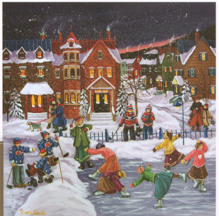
NICOLE LAPORTE, huile, 20" x 20", La pratique