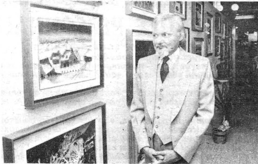
Normand a toutes les raisons d'être fier!