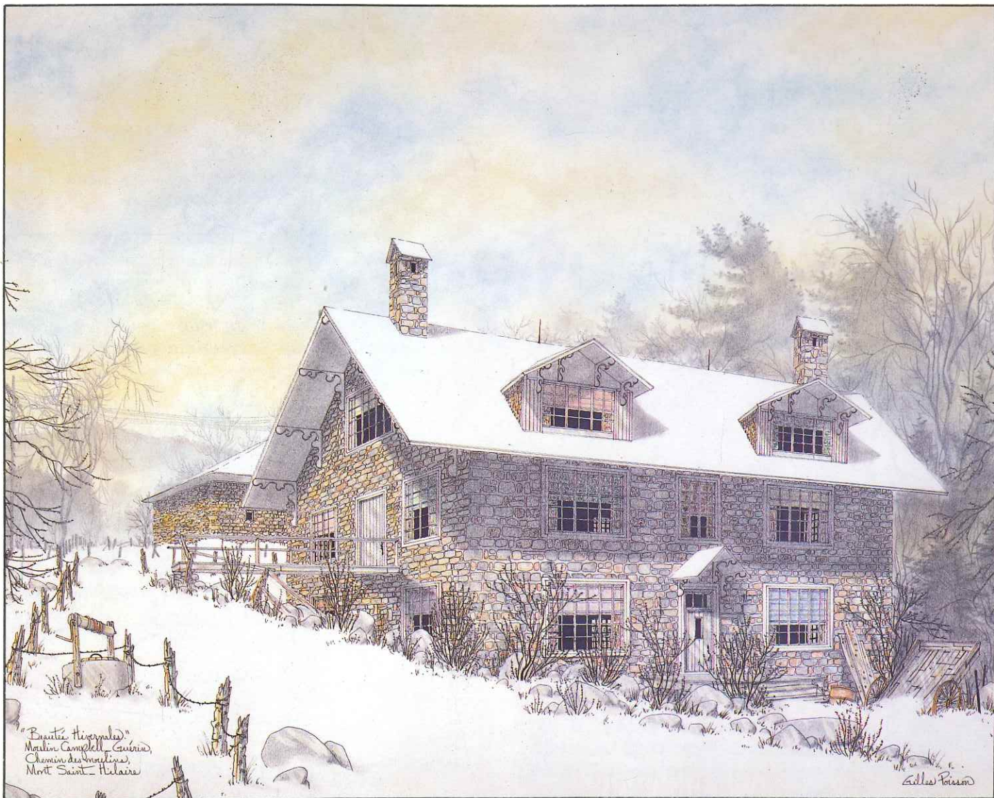
«Beauté hivernales» Moulin Campbell-Guérin, Mont Saint-Hilaire