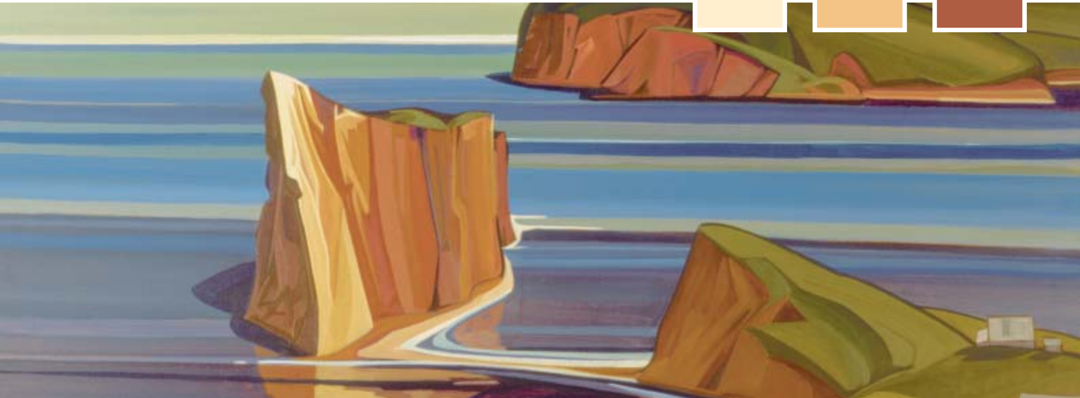
Paul "Tex" Lecor, Le rocher percé, circa 1987, acrylique sur canevas, 30 po. x 36 po.*