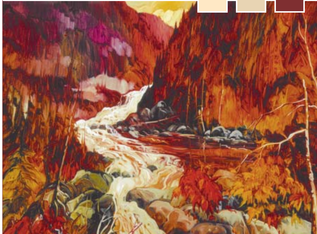
Jacques Poirier, Cascades, circa 2001, huile sur canevas, 30 po. x 36 po.*