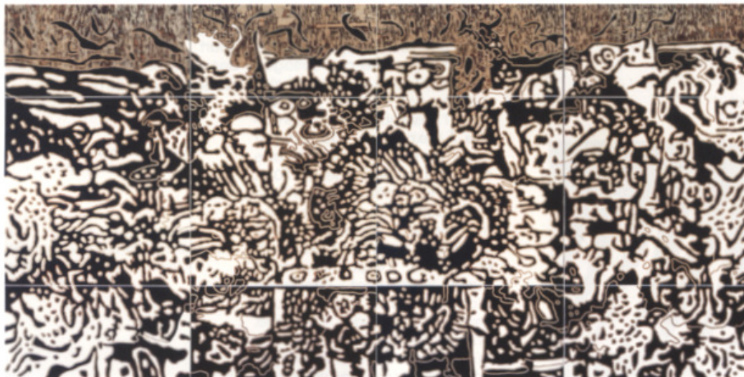
Les derniers territoires , 2015, bois relief polychrome, 96 x 192 pouces - 245 x 487 cm