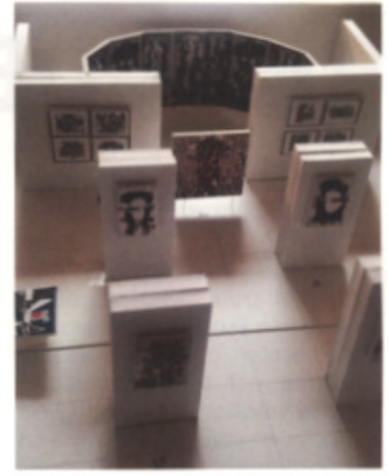
Maquette pour, Les derniers territoires Musée des beaux-arts de Sherbrooke 2010

trop simple. Et puis, Les derniers territoires, c'est aussi le titre d'une série de bois relief polychrome qu'il réalise en 2013. De [très] grands formats qui, considérant l'ampleur de la tâche et le fait qu'il soit devenu intolérant à la poussière de bois, portent à penser qu'il serait étonnant qu'il en refasse d'autres un jour. Ces œuvres, réalisées à l'ancienne usine de La Rolland, à Sainte-Adèle, sont issues de la même période que