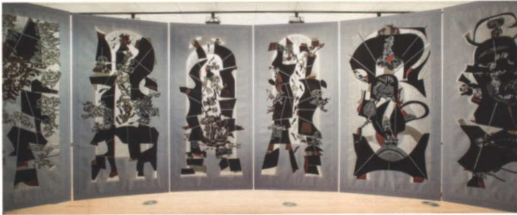
La chapelle, Capilla, installation, 2009, papier collé, papier troué, 10 modules de 96 x 48 pouces – 243 x 121 cm