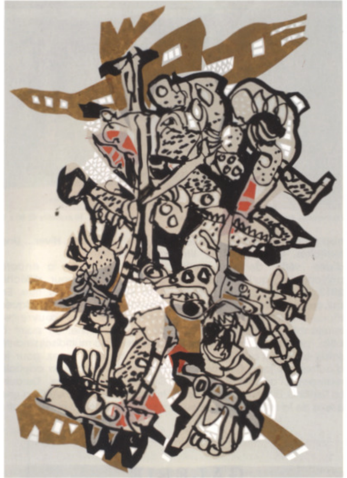
Suite Puebla , 2006, papier collé, papier troué, 48 x 52 pouces - 120 x 80 cm

L'exposition, par son titre, est énigmatique, et l'artiste ne fait rien pour dissiper le mystère... Une des particularités de l'ensemble des œuvres exposées est qu'elles ont toutes été réalisées à l'extérieur de son atelier de Val-David : Barcelone, Basse-Côte-Nord, Percé, lac Labelle, Mexique, Sainte-Adèle (à l'usine La Rolland)... Bien sûr, la pensée qu'il s'agit peut-être de son dernier tour de piste nous effleure l'esprit. Cependant, cette réponse serait [tellement]