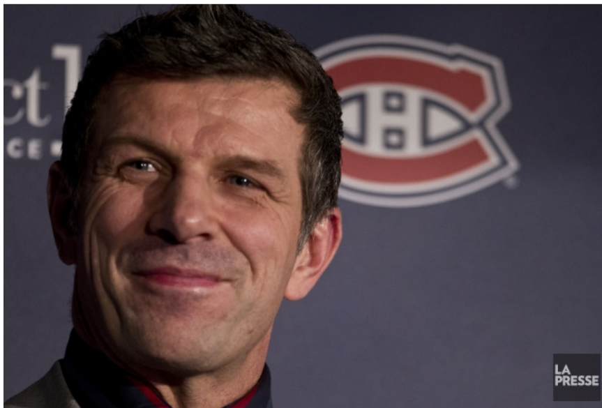
Le directeur général du Canadien, Marc Bergevin.